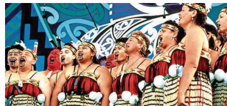
Den Maori-Frauen mit ihren Gesängen in Neuseeland begegnet man 27. Oktober in Kirkel.