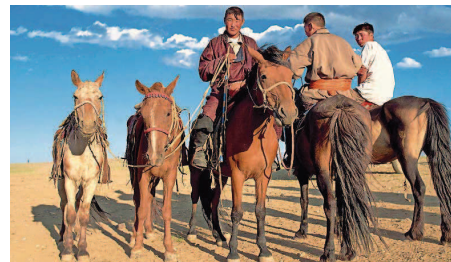
Mongolei, Wüste Gobi und Altai-Gebirge: Am 15. März gibt es Begegnungen mit den Menschen in Asien.