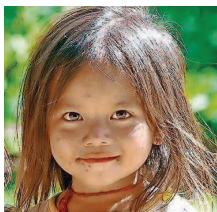
Kinder aus Laos sieht man am 17. November.