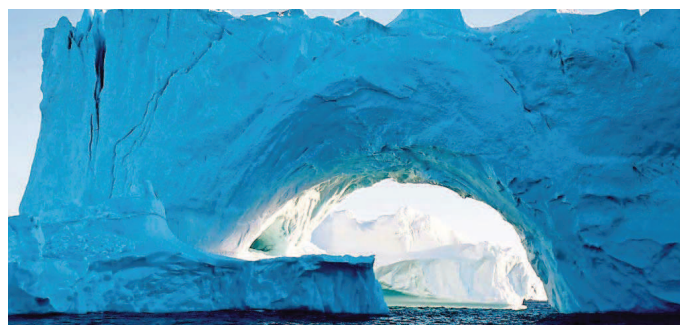
Den Eisbergen, den Gletschern, der bizarren Fauna und Flora der Insel Grönland ist der Vortrag am 21. April gewidmet. Ein Abend mit ungeahnter Farbenpracht.