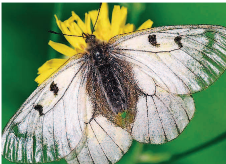
Schmetterlinge als Tänzer im Wind im Himalaya und in den Alpen sehen die Besucher am 11. Oktober.