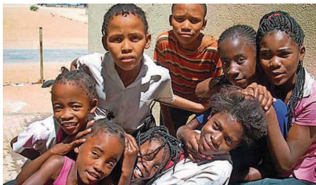
Einblicke in das Leben der Menschen in Namibia gibt es zum Auftakt der Abenteuer-Reihe am 19. Januar.