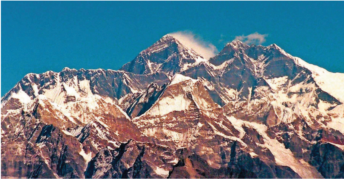
In das nahezu unbekannte Königreich Mustang im Himalaya werden die Besucher am 18. Februar in Kirkel entführt.