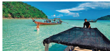
Am 2. Juni heißt es „Ein Jahr um die Welt“. Haltepunkte sind unter anderem auch die Inseln im Golf von Siam.